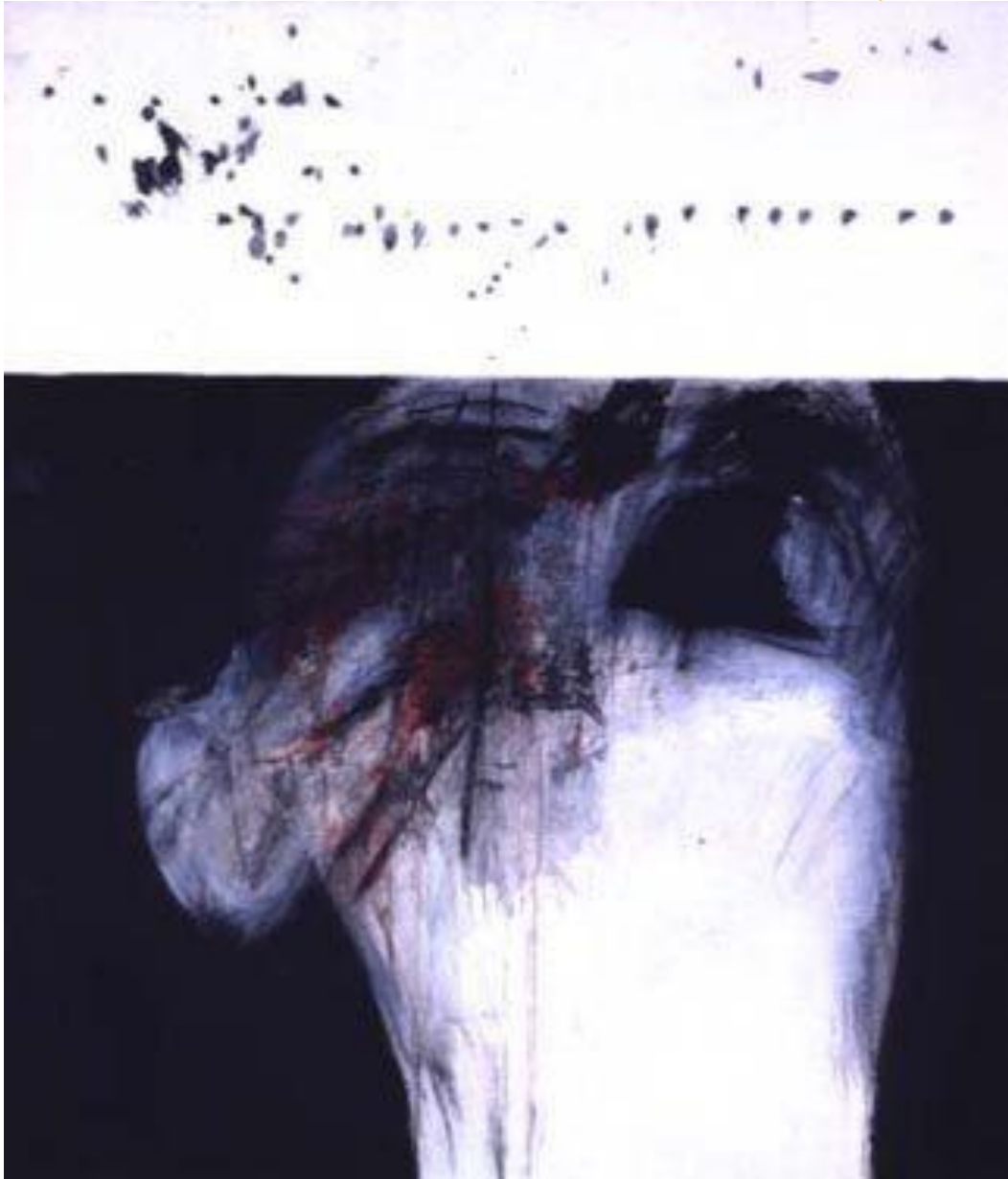
José Balmes, Vietnam herido , 1969