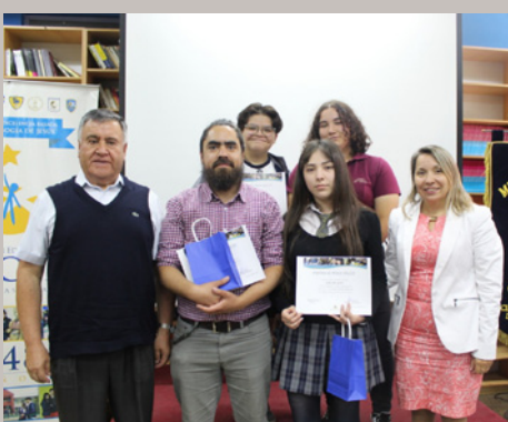
Liceo Sara Blinder