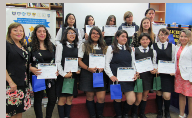
Complejo Educacional Mons. Luis Arturo Pérez