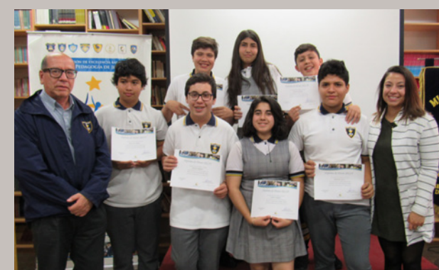
Liceo José Domingo Cañas