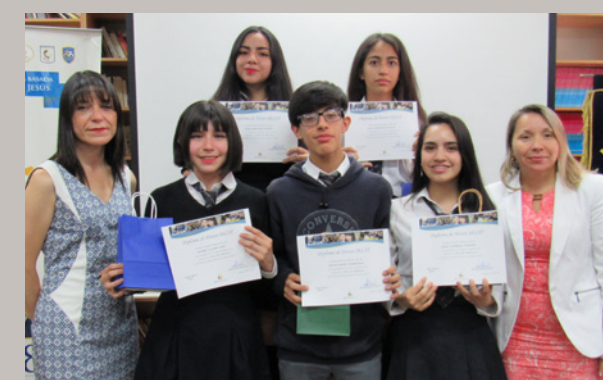
Liceo San Francisco