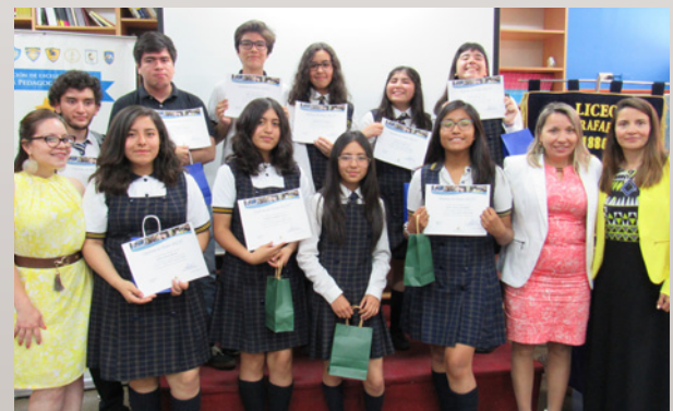
Liceo Miguel Rafael Prado – Educación Media