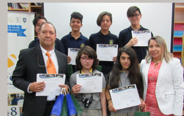
Colegio San Alberto Hurtado