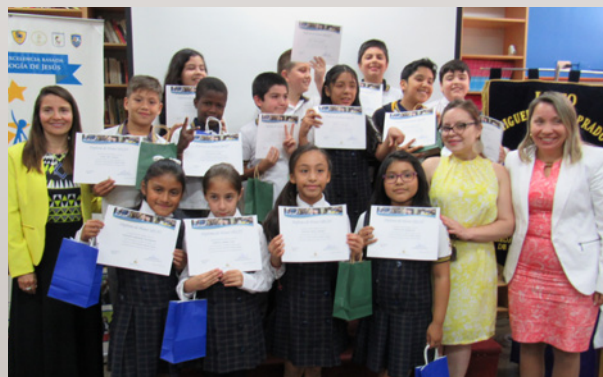
Liceo Miguel Rafael Prado – Educación Básica

Recibimos orgullosos nuestros diplomas en el acto de cierre de los Talleres de Periodismo 2018, que se realizó el jueves 6 de diciembre en el Liceo Miguel Rafael Prado, con presencia de autoridades de la SECST. La actividad, en su quinta temporada, batió dos importantes récords: la cantidad de estudiantes que participaron, 80 en total, y el que se haya ofrecido en todos los colegios de la Red durante el año.