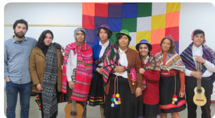
Exitosas presentaciones ha realizado el Taller de Teatro.