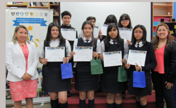
Escuela Nuestra Señora del Carmen