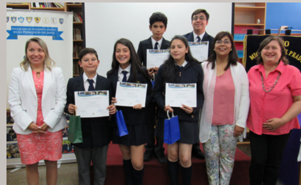
Colegio Santa Marta

“Les quiero mandar un cariñoso saludo a todos los que están trabajando en este taller, algo que tal vez nace de su vocación. Sigán en esto, sean perseverantes, que encuentren y disfruten de este mundo que se abre, al momento de tomar contacto con la gente, de conocer sus problemas, de tratar de colocar como relevantes cosas que para la gente son importantes. Decirles que si en el futuro logran abrazar esta profesión, voy a estar muy contento de poder llamarlos colegas”.