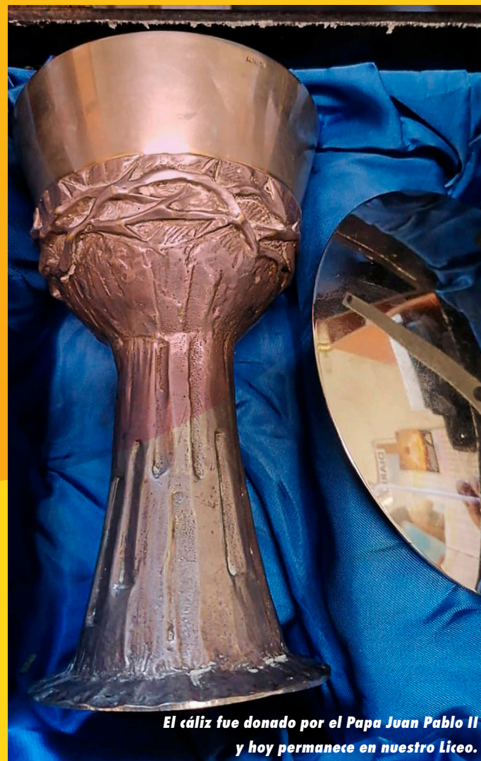
El cáliz fue donado por el Papa Juan Pablo II y hoy permanece en nuestro Liceo.