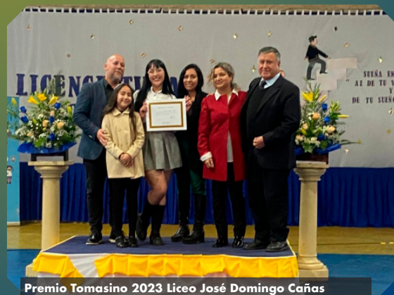
Premio Tomasino 2023 Liceo José Domingo Cañas