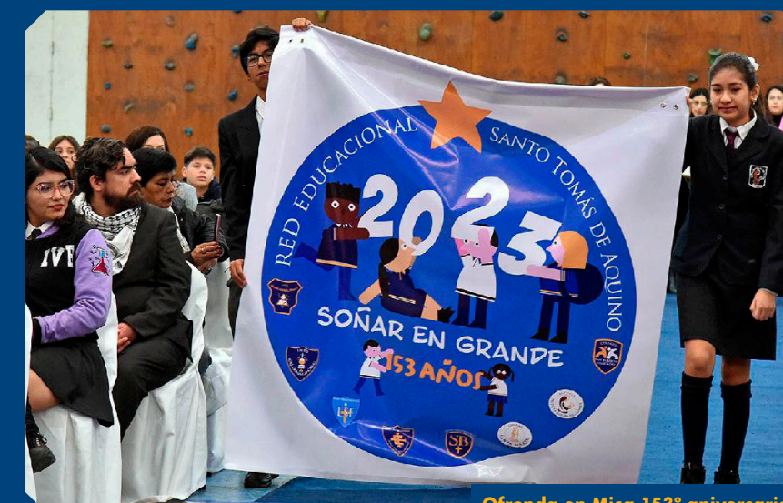
Ofrenda en Misa 153º aniversario

En tanto, en su homilía llamó a los presentes y a quienes estaban conectados a través del canal de YouTube de la Red, a comprometerse y seguir sembrando las semillas de los valores cristianos. "Niños, niñas, jóvenes, profesores, asistentes de la educación, y todos quienes