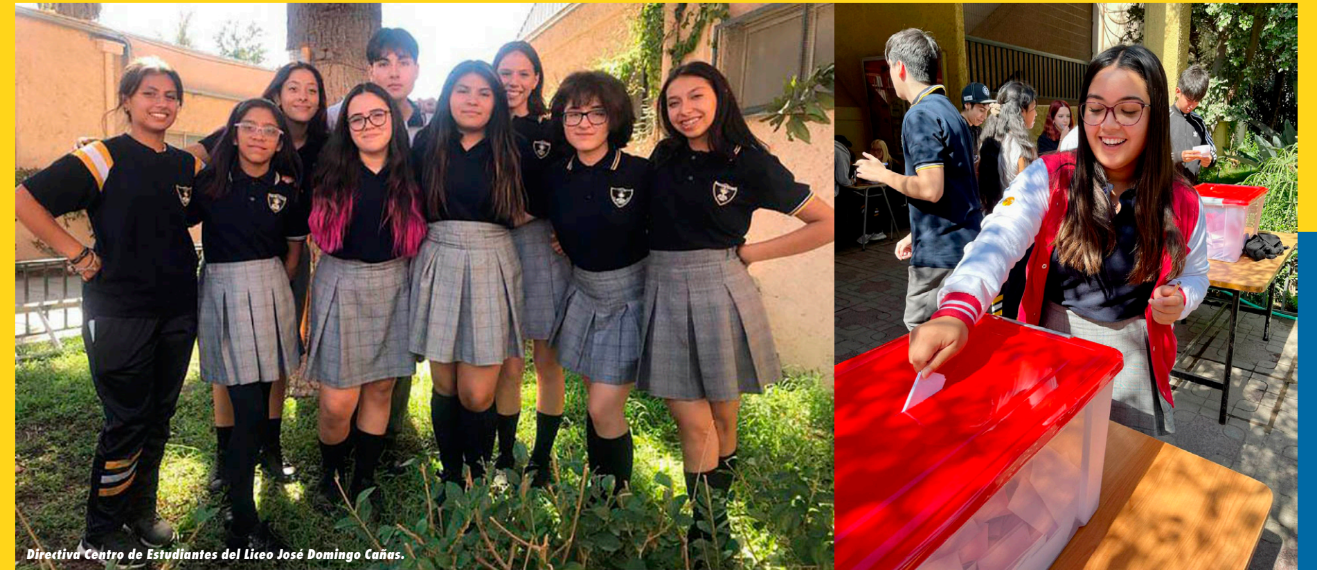
Directiva Centro de Estudiantes del Liceo José Domingo Cañas.

Por Equipo Taller de Periodismo Liceo José Domingo Cañas