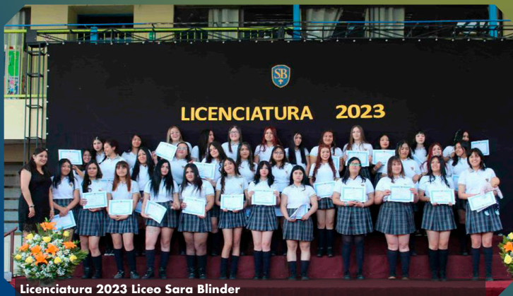
Licenciatura 2023 Liceo Sara Blinder