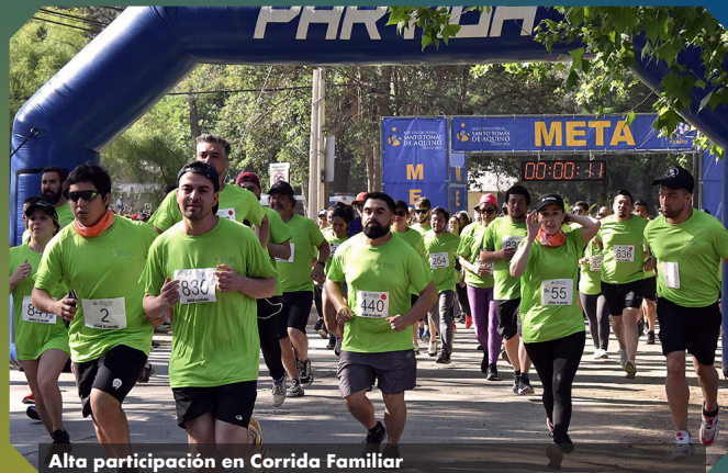
Alta participación en Corrida Familiar