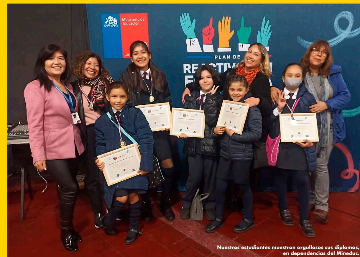
Nuestros estudiantes muestran orgullosos sus diplomas, en dependencias del Mineduc.