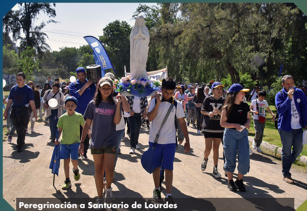
Peregrinación a Santuario de Lourdes

En el mes de Noviembre también se efectuaron las Olimpiadas Académicas, las que contaron con la entusiasta participación de delegaciones de estudiantes de los ocho establecimientos de la Red, los que compartieron conocimientos y habilidades en Lenguaje, Historia, Ciencias, Matemáticas, Religión, Inglés y Artes. Igualmente, en este período se llevaron a cabo las solemnes ceremonias de Licenciaturas de los estudiantes de IV Medio, en las cuales en cada establecimiento se entregó el Premio Tomasino, al alumno o alumna que se haya destacado por vivir durante su vida escolar los valores de nuestro patrono, Santo Tomás de Aquino.