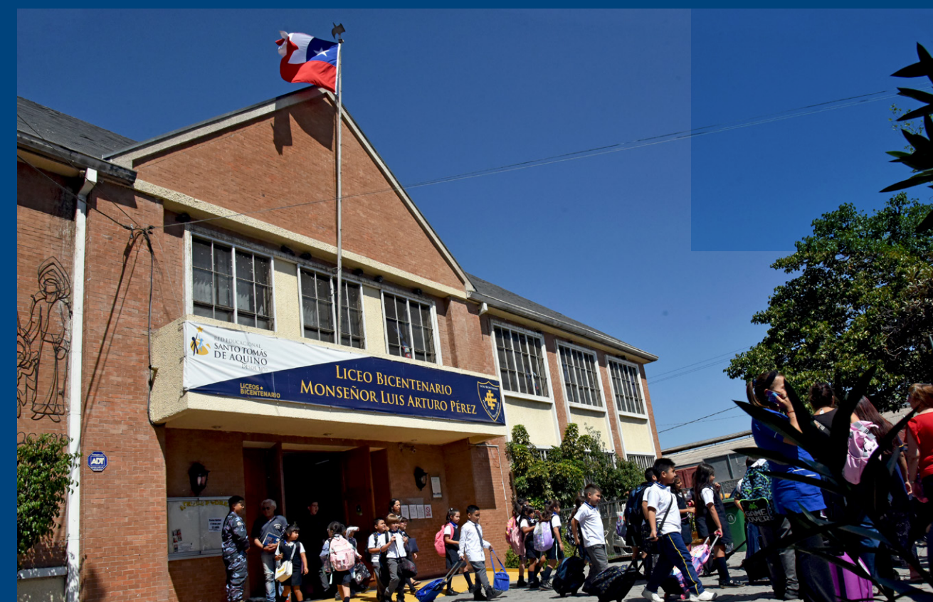
Este 2023 nuestro Liceo cumplió 60 años. En diciembre de 2020 pasó a ser Liceo Bicentenario.

Crear Liceos Bicentenario es una iniciativa que surge el año 2010, buscando apoyar a los establecimientos escolares para que alcancen, recuperen y/o mantengan estándares de calidad en sus aprendizajes, y de esta manera puedan acceder a mejores herramientas y oportunidades para sus estudiantes. En nuestro país hay 8.364 establecimientos de Educación Básica y Media, dentro de los cuales 320 son liceos Bicentenario. De estos últimos, 70 se encuentran categorizados con un nivel de desempeño alto, por parte de la Agencia de Calidad de la Educación. En diciembre de 2020, el Ministerio de Educación seleccionó a nuestro establecimiento como Liceo Bicentenario, en reconocimiento a su excelencia académica. Con esto, pasó oficialmente a llamarse Liceo Bicentenario Monseñor Luis Arturo Pérez.