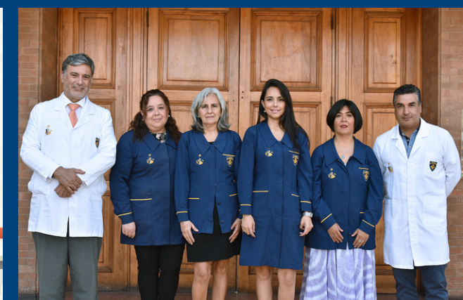
Nuestro liceo suma voluntades para brindar una educación de calidad a niños, niñas y jóvenes.